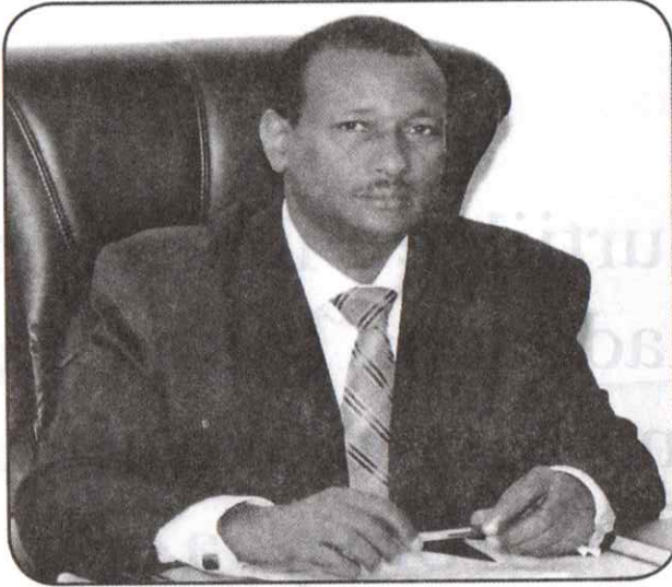
Obbo Damoozee Maammee Pir/Mana Murtii Waliigala Oromiyaa

Manni Murtii Waliigala Oromiyaa Aangoo fi dirqama seera hiikuu heeraa fi seeraan kennameef bu'uura godhachuudhaan kenniinsa tajaajila Abbaa seerummaa bu'a qabeessaa ta'e, hojimaataa Iftoomina qabuun kan kennaa jirudha.